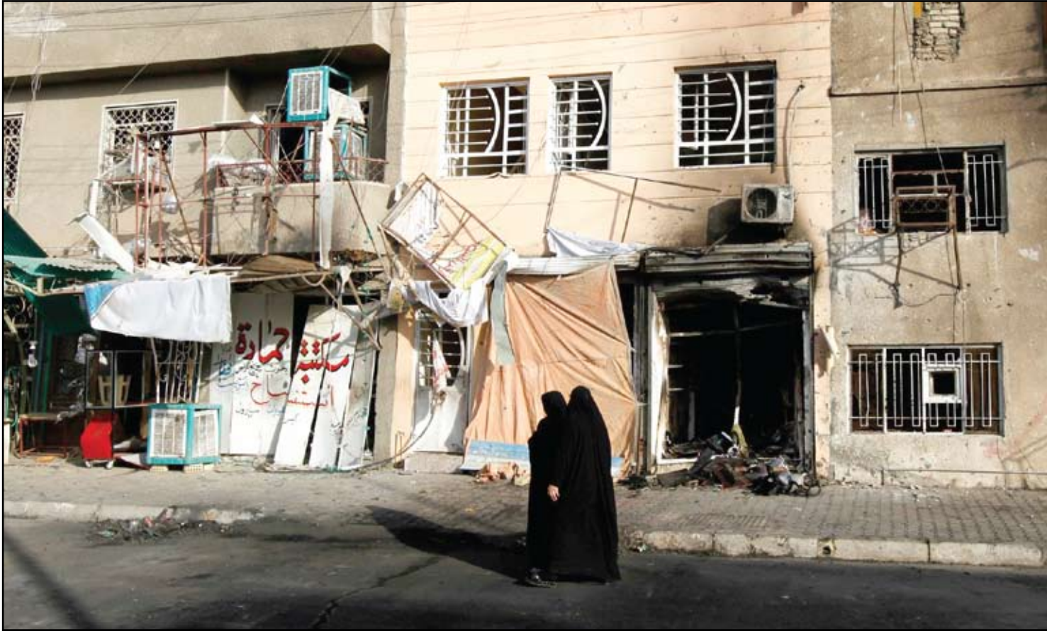
آثار خراب تقجير أرهايي في نينوى... أرشيف

السكان يطالبون بالاعتراف بشجاعة امرأة وإطلاق اسمها على أحد الشوارع في نينوى