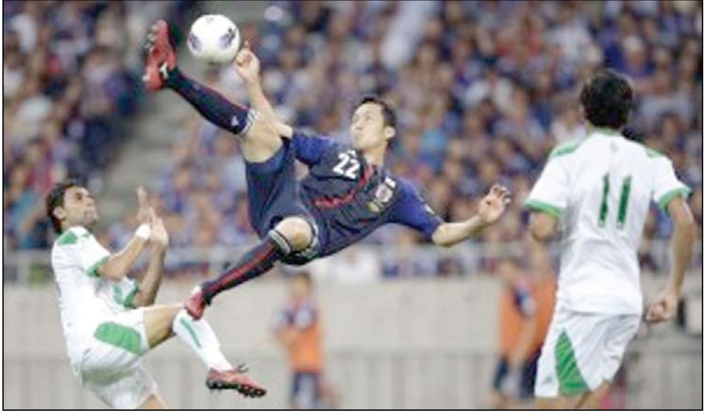
لقطة سابقة لأحدى مباريات منتخبنا مع اليابان

الأول الجمعة، حينما قاد جميع اللاعبين في وحدتين تدريبيتين، عقب الفوز الثالث الذي سجله منتخبنا في المجموعة الرابعة على الصين، بيوم واحد إذ شهدت الوحدات التدريبية الرفع من جاهزية اللاعبين وتطبيق بعض المفردات إضافة إلى تنفيذ الواجبات التكتيكية التي من شأنها أن تواجه أسلوب المنتخب الياباني الذي بلغ دور الثمانية للبطولة وصيفا للمجموعة الثالثة برصيد ٥ نقاط. وسيواجه منتخبنا الأولمبي نظيره الياباني في الساعة السابعة مساء بتوقيت العاصمة بغداد، وذلك على ملعب السبيل الذي شهد تفوق منتخبنا الأولمبي على منافسيه السعودي والأوكراني في