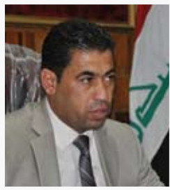
محافظ بابل صادق السلطاني

" حضرنا الاجتماع الخاص لمناقشة مشروع حي الحرفيين (الحي الصناعي) في محافظة بابل، الذي عقده منظمه صناعي وحرفي بابل، وأكدنا للحضور على انه سيتم الإعلان عن تصميم المشروع قريبا جدا وفق معايير عصرية ومتطورة ليكون بصمة تاريخية للمحافظة، ان هذا المشروع سيشغل أيدي عاملة كثيرة من أبناء المحافظة ويعطي دفعة معنوية عالية لطبقة الحرفيين والصناعيين "