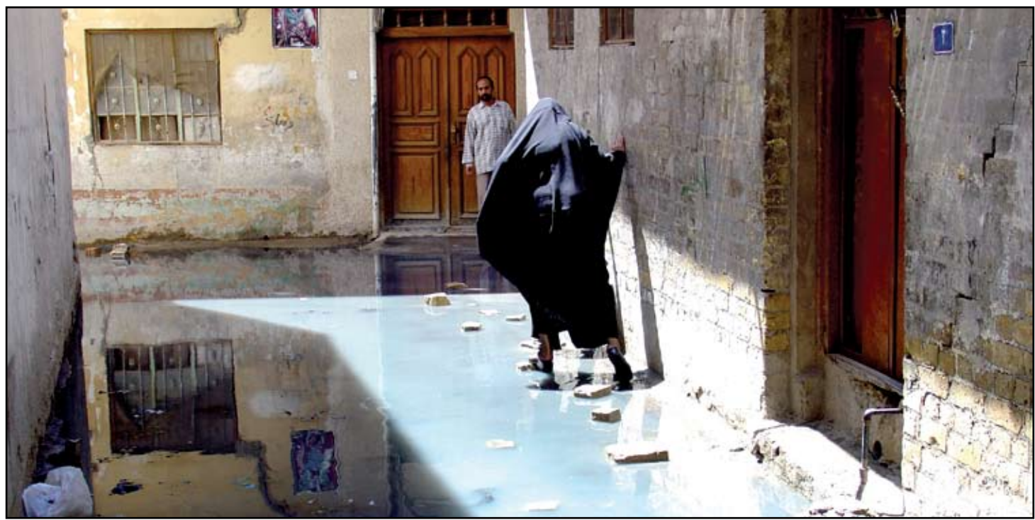
بغدادية تتفادى مياه الامطار في إحدى محلات بغداد القديمة..