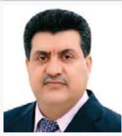
المتحدث باسم وزارة البيئة أمير الحسنون

" حضرنا الاجتماع الخاص لمناقشة مشروع حي الحرفيين (الحي الصناعي) في محافظة بابل، الذي عقده منظمه صناعي وحرفي بابل، وأكدنا للحضور على انه سيتم الإعلان عن تصميم المشروع قريبا جدا وفق معايير عصرية ومتطورة ليكون بصمة تاريخية للمحافظة، ان هذا المشروع سيشغل أيدي عاملة كثيرة من أبناء المحافظة ويعطي دفعة معنوية عالية لطبقة الحرفيين والصناعيين "