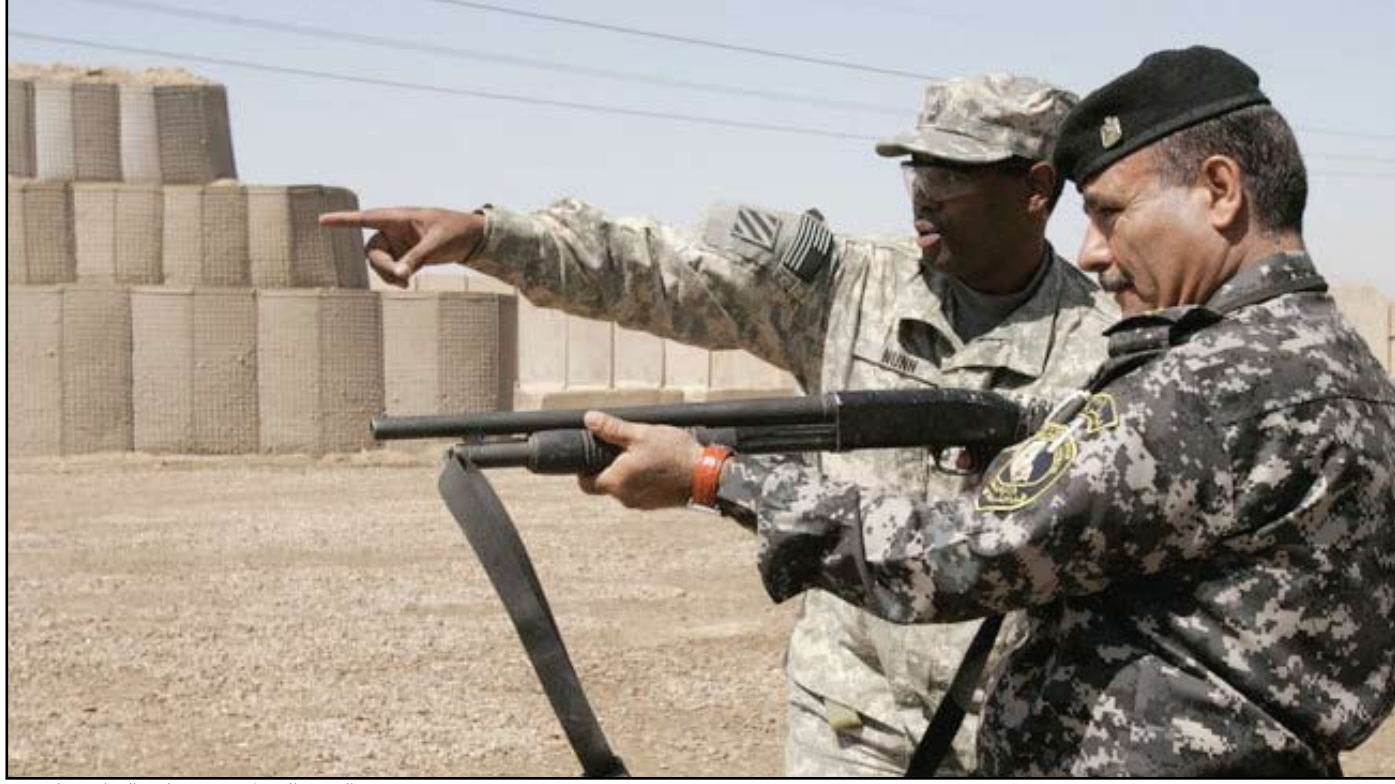
عصر من الجيش الأميركي يدرّب نظيره العراقي - أرشيف

أكد مسؤول كبير في وزارة الدفاع الأميركية لوكالة فرانس برس أن الجيش الأميركي مستعد لتدريب قوات عراقية في بلد آخر على مهمات لمكافحة الإرهاب بغية محاربة المتمردين المرتبطين بتنظيم القاعدة. وأضاف هذا المسؤول، طالبا عدم كشف هويته، أن هذا التعاون سيتم "على الأرجح" إذ أن واشنطن وبغداد تدعمان المبادرة، شرط موافقة الأردن على استضافة جنود أميركيين وعراقيين.