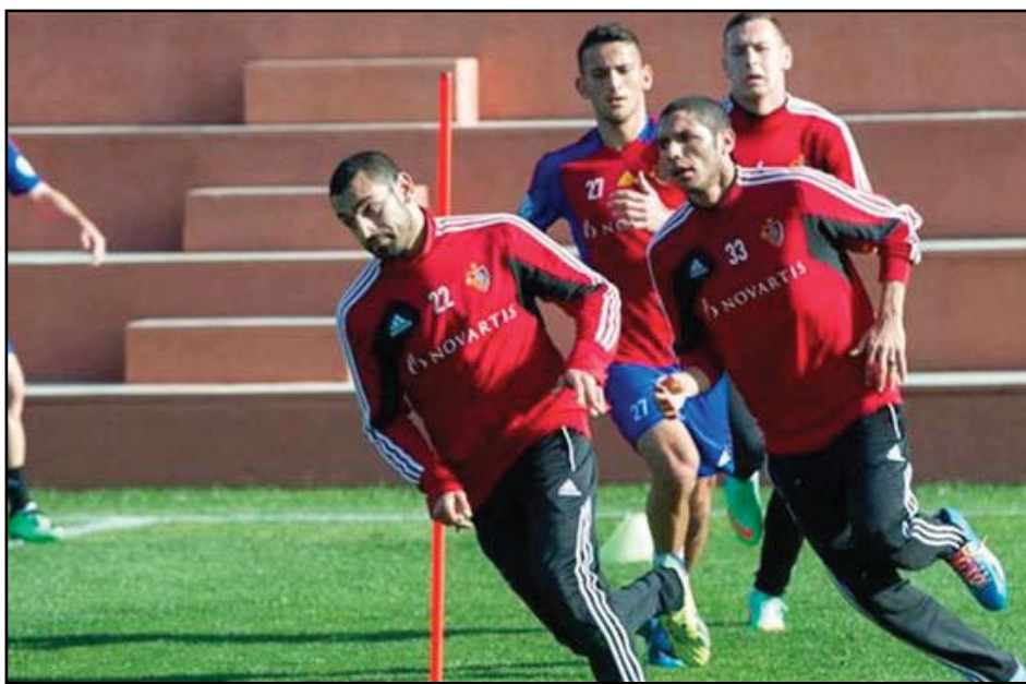
ليفربول يسمي لتدعيم صفوفه بصفقات جديدة

وأوضح الموقع الذي يحتوي على جميع أخبار ليفربول، أن رودجرز عليه أن يقوم بتدعيمات ضئيلة للغاية في شهر كانون الثاني بسبب القيود التي تم وضعها على الميزانية المالية للصفقات في الشهر الحالي . وفي تصريح لروجرز عن الصفقات الجديدة، رد قائلاً "لا توجد أية تطورات جديدة حتى الآن، نحن نعمل منذ أشهر عدة على بعض الصفقات التي قد تدعم فريقنا ولكن يجب علينا أن نرى كيف ستتم هذه الصفقات خلال الأسبوعين القادمين إلا أنه اعترف بصعوبة الأمر وبالتحديد صعوبة إبرام الصفقة المنتظرة وهي ضم محمد صلاح الجناح المصري لنادي بازل السويسري.