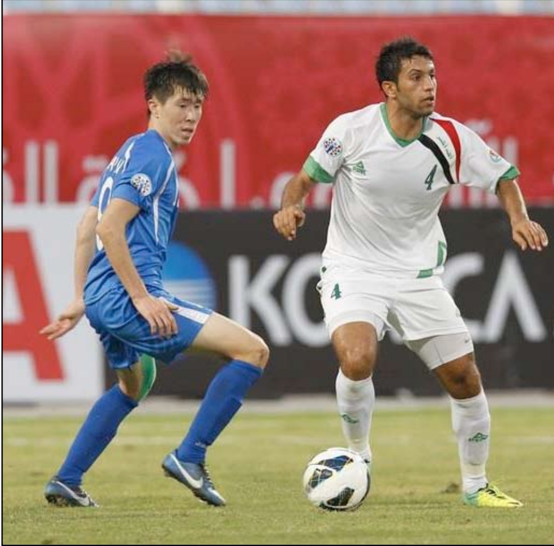
الأولمبي يسعى للتاهل للدور نصف نهائي على حساب اليابان