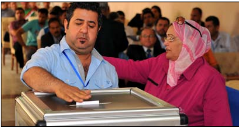
تواصل انتخابات الاتحادات الرياضية

الرياضية الوطنية باقامة ٣ مؤتمرات انتخابية حيث تجري في الساعة العاشرة من صباح اليوم الأحد انتخابات اتحاد الدرجات تعقبها في الساعة الواحدة ظهراً انتخابات اتحاد الشرطة تليها بساعتين انتخابات اتحاد البليارد.وجرت يوم أول من امس الجمعة في فندق المنصور ميديا ببغداد انتخابات الاتحاد العراقي المركزي للملاكمة وشارك فيها ١٠٥ اعضاء يمثلون اعضاء الهيئة العامة البالغ عددهم ١٠٦ اعضاء وتنافس للفوز بالمقاعد الثمانية المخصصة لعضوية الهيئة الإدارية ١٥ عضواً حيث فاز ٧ اعضاء في الجولة الاولى ممن حصلوا على نصف عدد