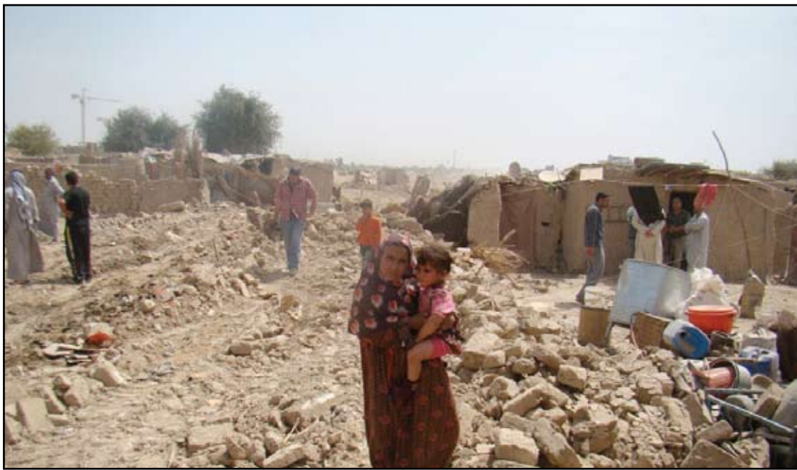
أحد أحياء الحواسب التجارزة جنوب بغداد

لذلك يوجد هناك تحد في هذا الموضوع وهو ارتفاع نسبة الموازنة التشغيلية ضمن الموازنة العامة للعام الحالي . وأضاف العلق إن "دراساتنا تؤكد أن هناك تناميا كبيرا في القوى العاملة بالقطاع العام، وهذه ميزة أخرجت وضع الموازنة العامة للعام 2014، عند تخصيص غالبيتها لتغطية الرواتب والأجور للموظفين قياسا بما سوف يخصص للموازنة الاستثمارية لكل