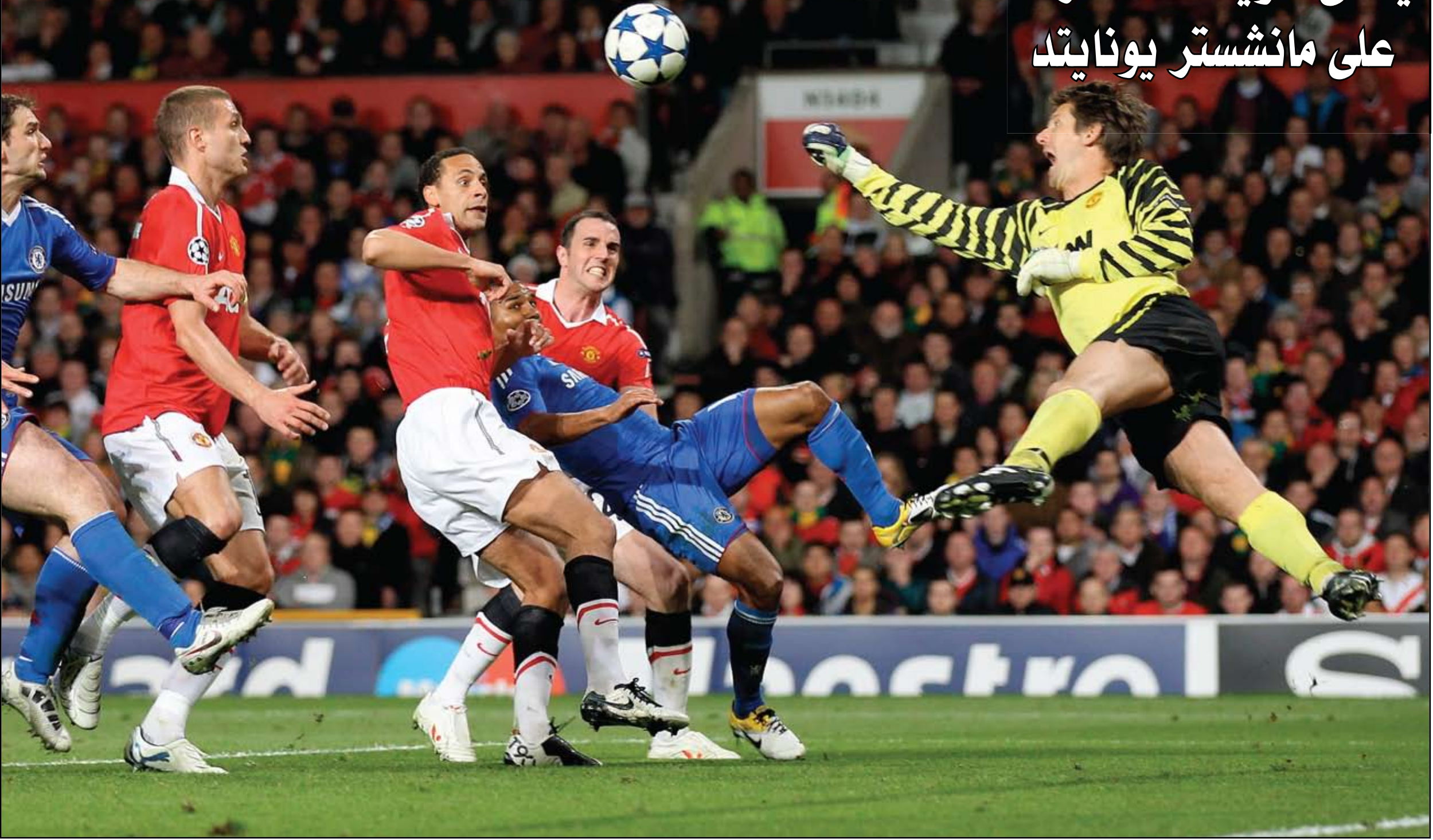
مواجهة من العيار الثقيل بين تشيلسي ومانشستر يونايتد

جديد." وأضاف "المرب هو قائداً وسوف يقوم بتغيير الأمور." وتابع فان بيرسي "خسرنا الكثير من النقاط هذا العام لكننا نبذل قصارى جهدنا لتغيير هذا الوضع." ويأتي يونايتد في المركز السابع على قائمة فرق الدوري وفرصته ضعيفة في الاحتفاظ بلقبه وخرج من كأس الاتحاد الإنجليزي بعد بداية صعبة تحت قيادة موزين الذي حل مكان المدرب اليكس فيرسون بنهاية الموسم الماضي.