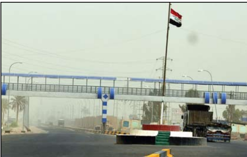
ثكنة عسكرية تغلق الجسر

غلق النفق احتراز أمني بعد تحوله إلى ملاذ للمشتردين بدلا من أن يكون ملاذا للمواطنين وسلامتهم من عبور شوارع ساحة التحرير المزدهم بالعجلات؟!