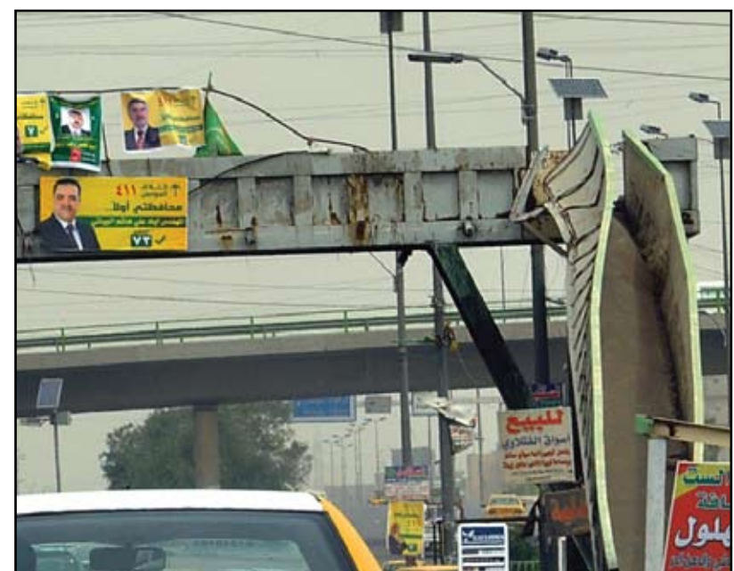
أحد جسور المشاة المحالة إلى التقاعد