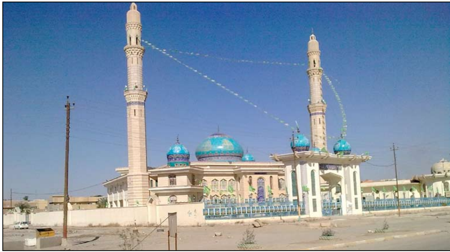
أحد جوامع مدينة الفلوجة- ارسيف

أوصياء على أهل الأنبار الأحرار وسنحارب فكرهم ومخططاتهم اللعينة". وشدد الدليمي على ان المحافظة "ستحاسب الأشخاص الذين في الخارج ويعملون على حث الإرهاب وفقا للقانون". وكانت عدد من وسائل الإعلام تناقلت، امس السبت، خبرا عن محافظ الأنبار أحمد الدليمي، خلال مؤتمر صحافي عقد عقب اجتماع مع قادة أمنيين، أكد فيه أن العمليات العسكرية ستبدأ في الفلوجة بعد انتهائها في الرمادي. وفي سياق التطورات الميدانية، قال مصدر امني في محافظة الأنبار، امس، ان "معلومات استخبارارية وتقارير من المروحيات القتالية أفادت بوجود شاحنة تحمل اموالا ووقودا لداعش في جزيرة