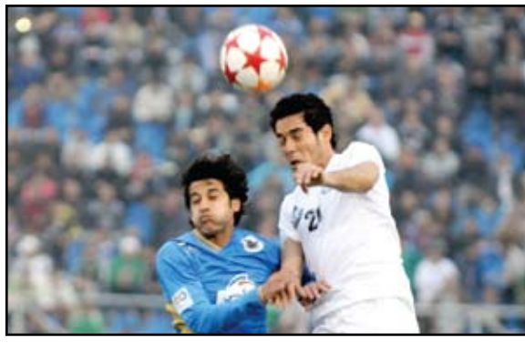
العراق يضيف بطولة العالم العسكرية