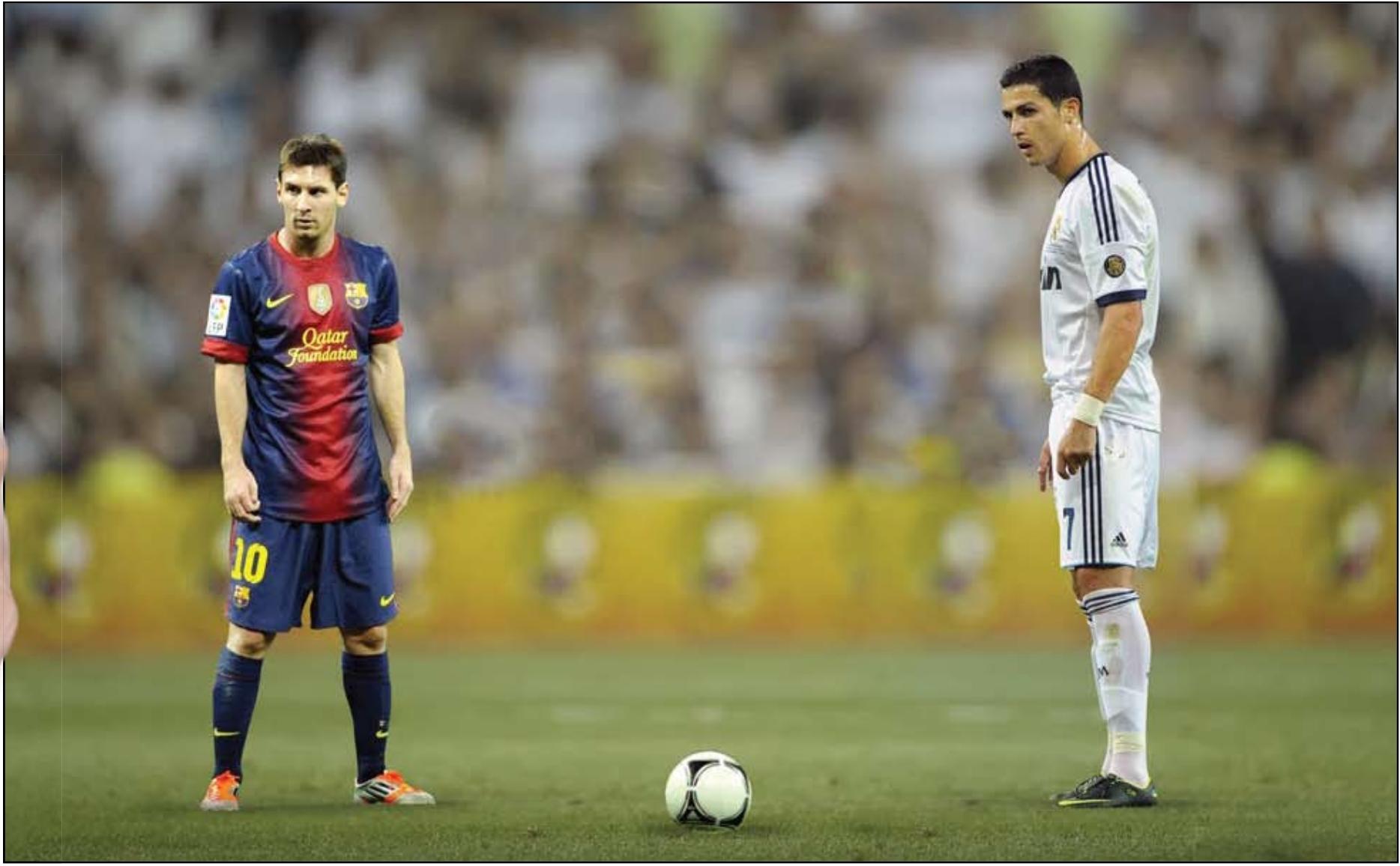
ميسي لم يزل يحتل صدارة اللاعبين الأعلى قيمة

وفي لقاء آخر تألق كريس بوش وسجل ٢٥ نقطة ليقود ميامي هيت للفوز ٨٦-٨١ على فيلادلفيا سفيتني سيكرز ويوقف سلسلة من ثلاث هزائم متتالية. وساعد ليرون جيمس فريقه هيت أيضا على الفوز بإحراز ٢١ نقطة وتوزيع عشر كرات حاسمة ومتابعة ثماني كرات مرتدة. وحقق هيت فوزه ٢٨ هذا الموسم مقابل خسارته ١١ مرة. وهذه الهزيمة الخامسة لفيلادلفيا في آخر ست مباريات لكنها الخسارة لهذا الموسم مقابل فوزه ١٣ مرة فقط.