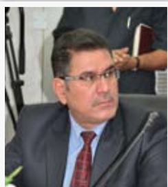
رئيس مجلس محافظة ميسان رحيم الشواي

" الملاكات الهندسية والفنية لمديرية كهرباء الفرات الأوسط أنجزت ما نسبته ٩٦٪ من أعمال الصيانة على الوحدة التوليدية الثالثة في محطة المصيب الحرارية، ان أعمال التأهيل شملت مولدة الوحدة التي تعرضت إلى حريق تسبب بخروجها عن العمل بتاريخ ٢٣ من تشرين الثاني من العام الماضي، فضلا عن التورباين، ومن المؤمل دخول الوحدة إلى العمل قبل نهاية الشهر الحالي، بطاقة ٢٠٠ ميكاواط .