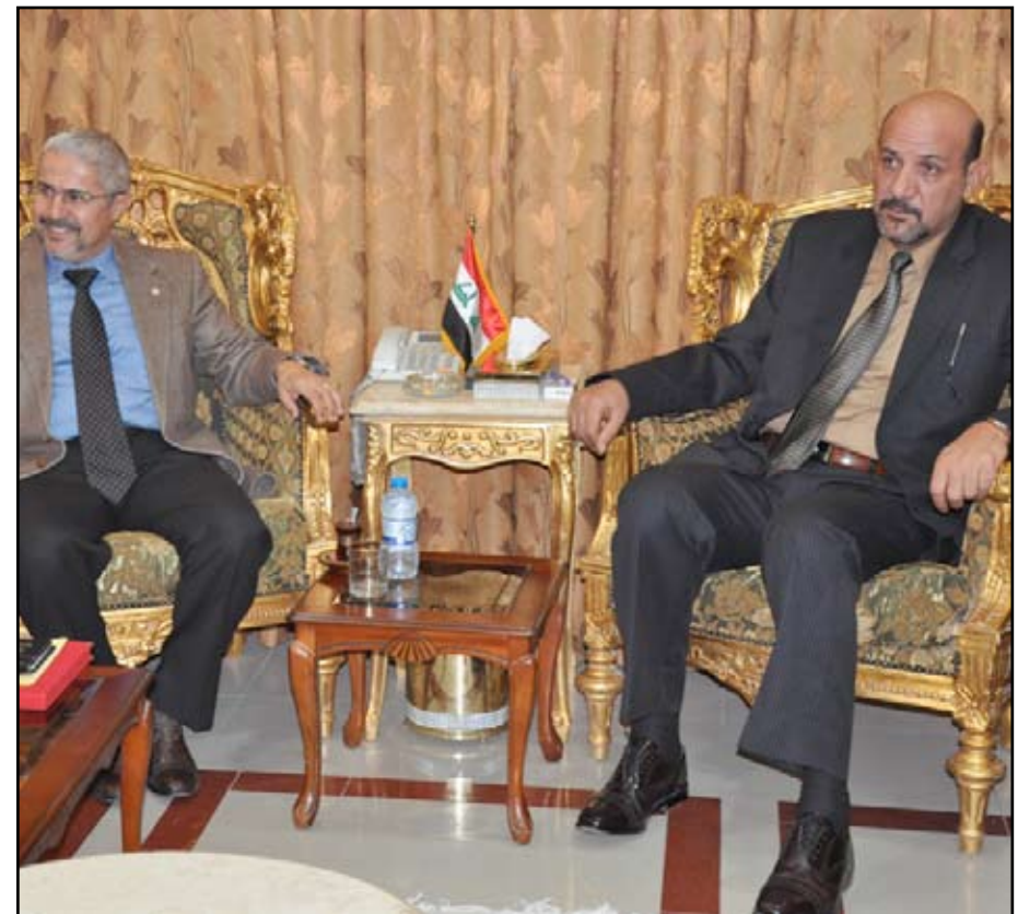
الشباب تدعم تضييف العراق للمونديال العسكري

وقدم الوفد الضيف في ختام اللقاء الى وكيل الوزارة درع المجلس العسكري للرياضة العسكرية (السيزيم).