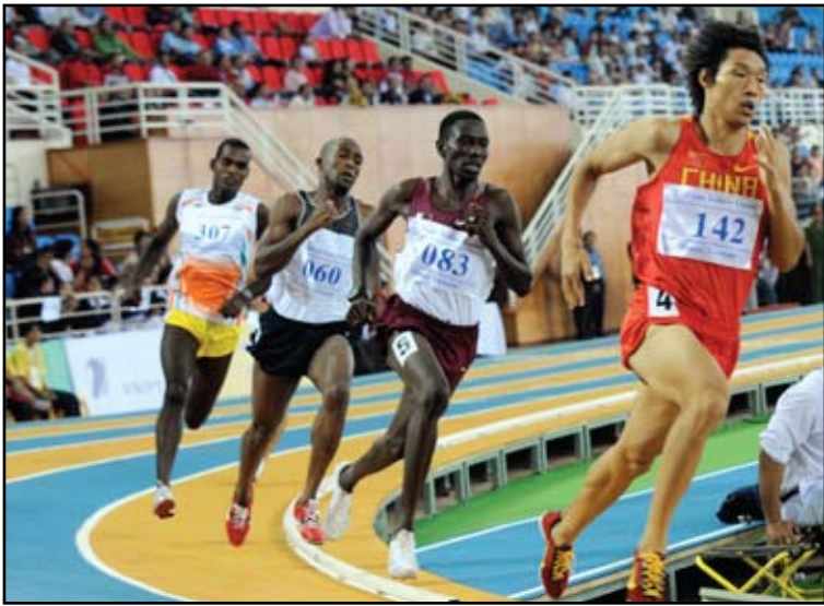
مانيلتا تحتفل بذكرى أول دورة رياضية متعددة الألعاب

وكان الفهد التقى رئيس الفلبين بينو اكينو وأكد له تعاطف المجلس الاولمبي مع الشعب الفلبيني بعد هذا الاعصار، كما ترأس الجمعية العمومية الثانية والثلاثين. وشهدت الجمعية العمومية عرضاً من الدول التي ستضيف الدورات الآسيوية المقبلة لأخر استعداداتها وخصوصاً اللجنة المنظمة لاسيا ايشيون الذي يتوقع ان يشارك فيه نحو ١٣ رياضياً وإدارياً من ٤٥ دولة آسيوية.